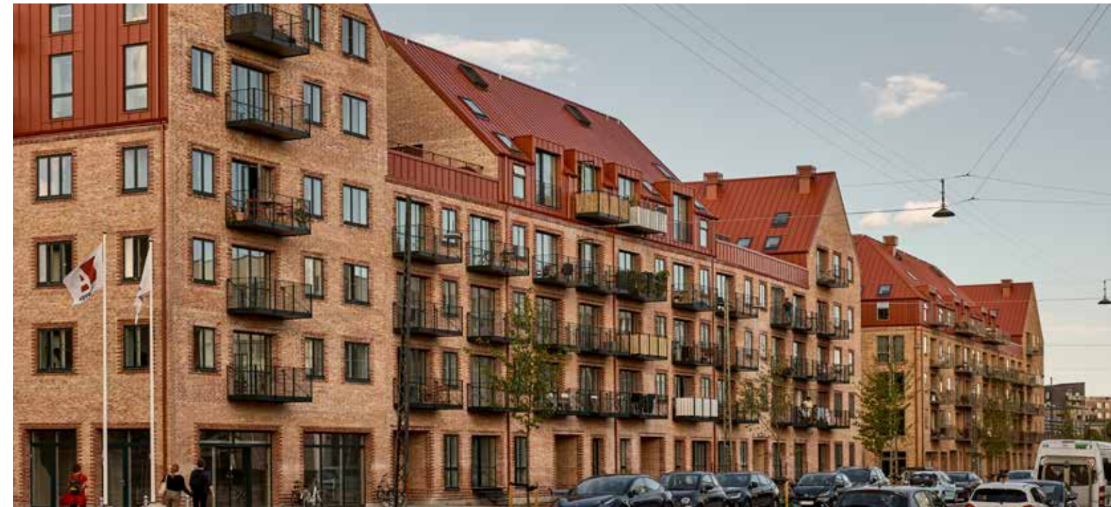
DS NORDIC KLIKFALS 475 · TAG- OG FACADEPROFILER · Teglrodt · BYGGEÅR: 2023 · BYGHERRE: AG GRUPPEN · ARKITEKT: SWECO ARCHITECTS