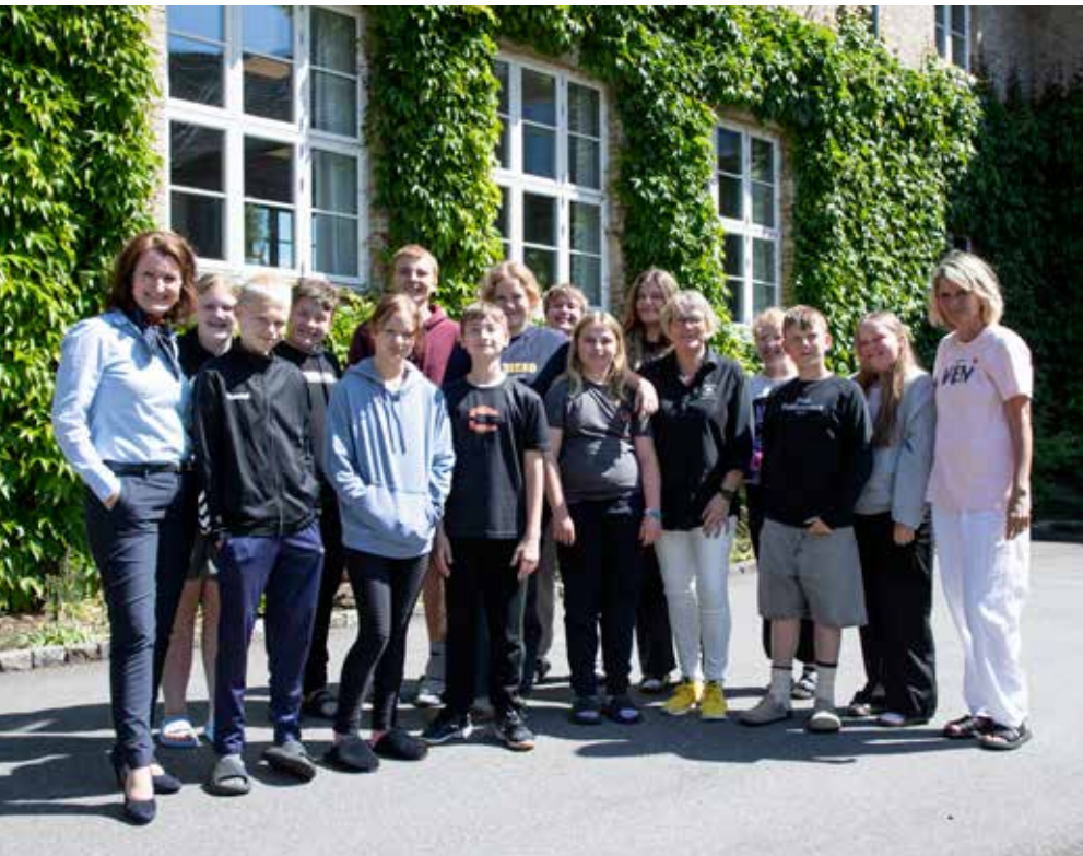
Der blev også mulighed for at hilse på nogle af børnene fra Julemærkehjemmet.

viser, at vi er rummelige og giver muligheder til alle.