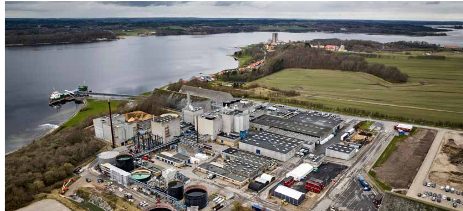
PROJEKTERING, PRODUKTION OG MONTAGE AF SPECIALKONSTRUKTIONER TIL 35 M HØJT PROCESTÅRN SAMT PLATFORME, TRAPPER OG RØRBROER