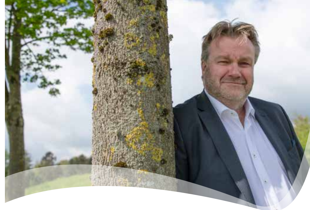
LEDER: Ansvarshavende redaktør MORTEN KAAD , Co-CEO, DS Gruppen og admin. direktør for DS Stålkonstruktion