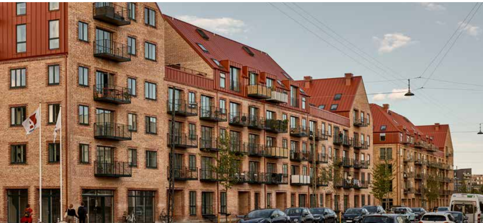
DS NORDIC KLIKFALS 475 · TAG- OG FACADEPROFILER · TEGLRØD · BYGGEÅR: 2023 · BYGHERRE: AG GRUPPEN · ARKITEKT: SWECO ARCHITECTS